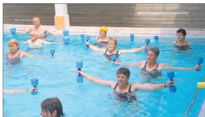
Die Frauen bei der Wassergymnastik zum Wellnesswochenende 2011 in Bad Steben